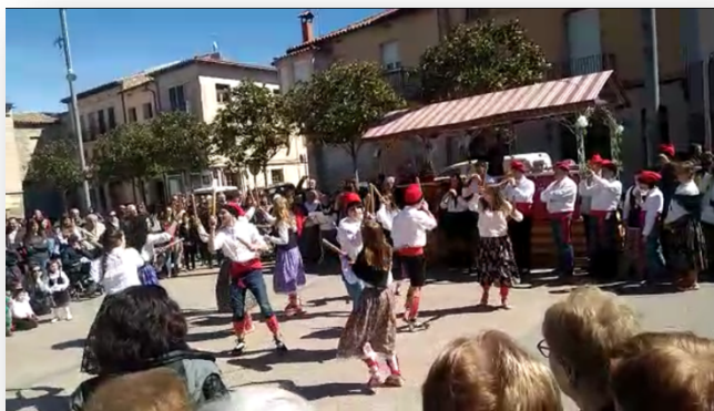
Foto del ball de bastons a la Plaça Major d'Avinyó

I amb la primavera van arribar les caramelles. Guarnits amb set vetes, barretina i faixa, i reixeta i faldilles vam acompanyar els Cantaires durant la seva cita anual amb els carrers i places del poble. Vam començar tard, no ens enganyem, per molt que voltem seguim sent avinyonencs de soca-rel i la impuntualitat no la perdrem mai. Què dir de les caramelles? "No pugeu al carro!" "Les cintes tibades!" "No tibeu tant les cintes!" "Piqueu fort amb els bastons!" "Els uns per dins i els dosos per fora!" fins que vam arribar a la residència. Després de tocar-hi els balls regulant tant com vam poder el volum, ens van recompensar amb una mica de berenar. I a dormir d'hora que demà matinem!