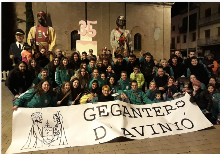
Foto de la Colla de Gegants d'Avinyó i de la Colla de Grallers i Timbalers d'Avinyó al final de la trobada de gegants del 17 de març