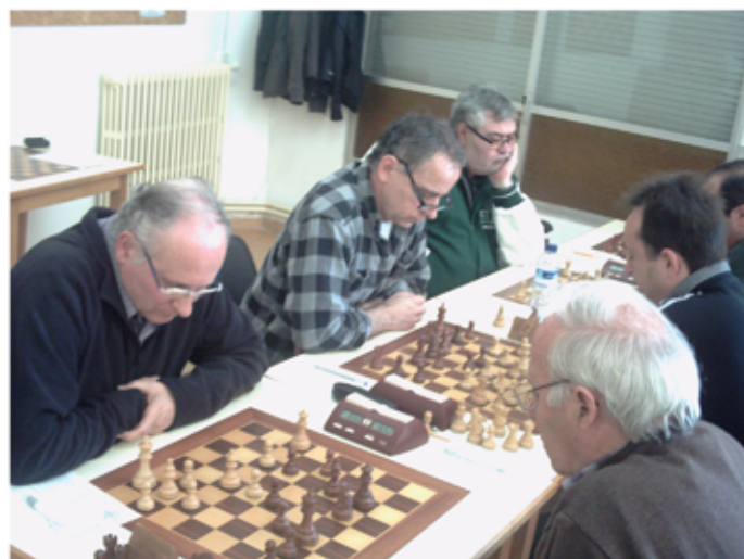
Serrat i Riera van obtenir els màxims increments d'ELO